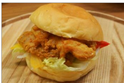
「タンドリーチキン&サンドイッチ」