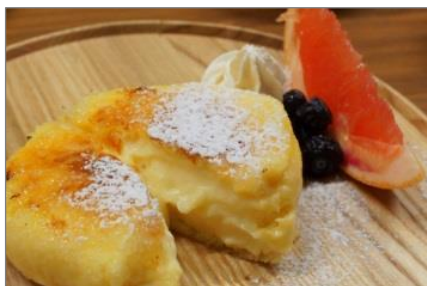
「とろけるくりーむフレンチトースト」