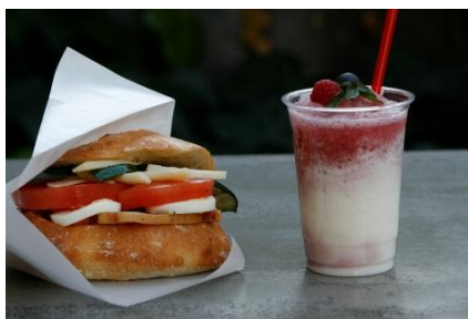
(左)ミモザ 600円(税込) (右)ヨーグルトとミックスベリーのジュース 350円(税込)