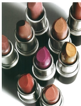
「M・A・C」商品イメージ