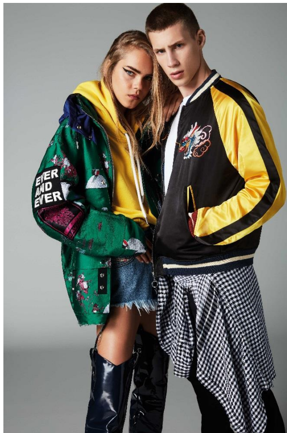
ブランドイメージ

東京メトロ駅構内店舗および商業施設の企画・開発・運営管理、リテール事業を行う株式会社メトロプロパティーズ（本社：東京都台東区、代表取締役社長：齋藤敏和）は、東京メトロ東京駅の駅チカ商業施設「Echika fit（エチカフィット）東京」に2018年11月22日「DIESEL」をオープンいたします。詳細は別紙をご覧ください。