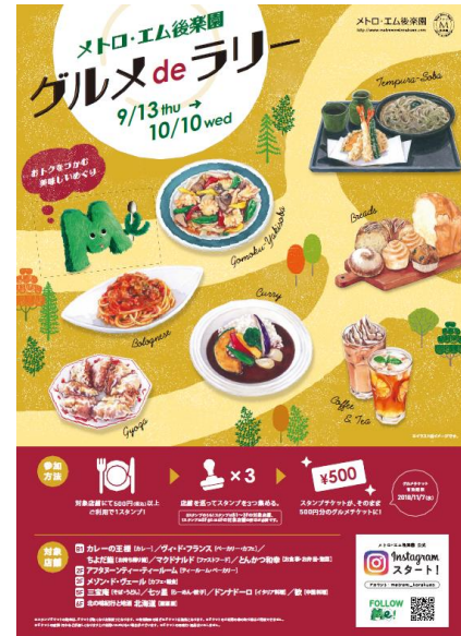
「グルメ de ラリー」ポスターイメージ