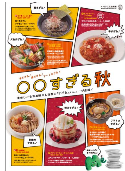
「〇〇すぎる秋！」チラシイメージ