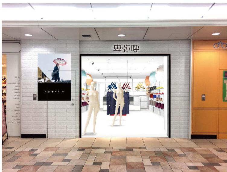
ファサードイメージ

東京メトロ駅構内店舗および商業施設の企画・開発・運営管理、リテール事業を行う株式会社メトロプロパティーズ（本社：東京都台東区、代表取締役社長：齋藤敏和）は、東京メトロ池袋駅の駅チカ商業施設Echika（エチカ）池袋に、シューズブランド卑弥呼の新業態となるレインファッションのトータルコーディネートを提案する「卑弥呼」（株式会社卑弥呼）を平成30年3月16日(金)にオープンいたします。