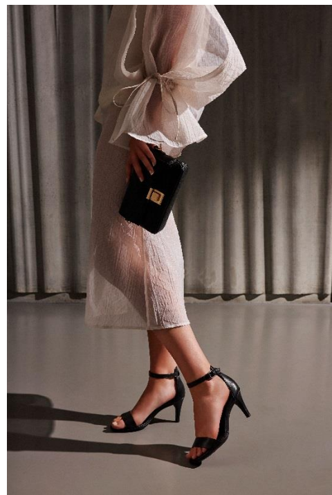
ブランドイメージ

■ オープニングキャンペーン シューズ・バッグをご購入のお客様先着50名様にECCOオリジナルレザー製 ペンシルケースDIYキットをプレゼント。