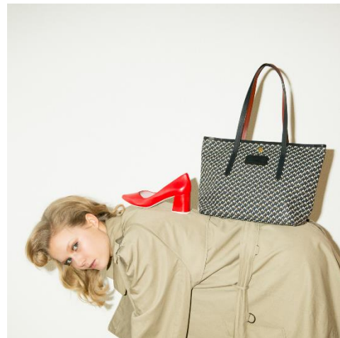
ブランドイメージ

■ オープニングキャンペーン 3/16 (金) ~ 3/25 (日) 10日間限定 お買い上げ金額20,000円(税込)以上の方に、キーホルダーをプレゼント。 ※無くなり次第終了