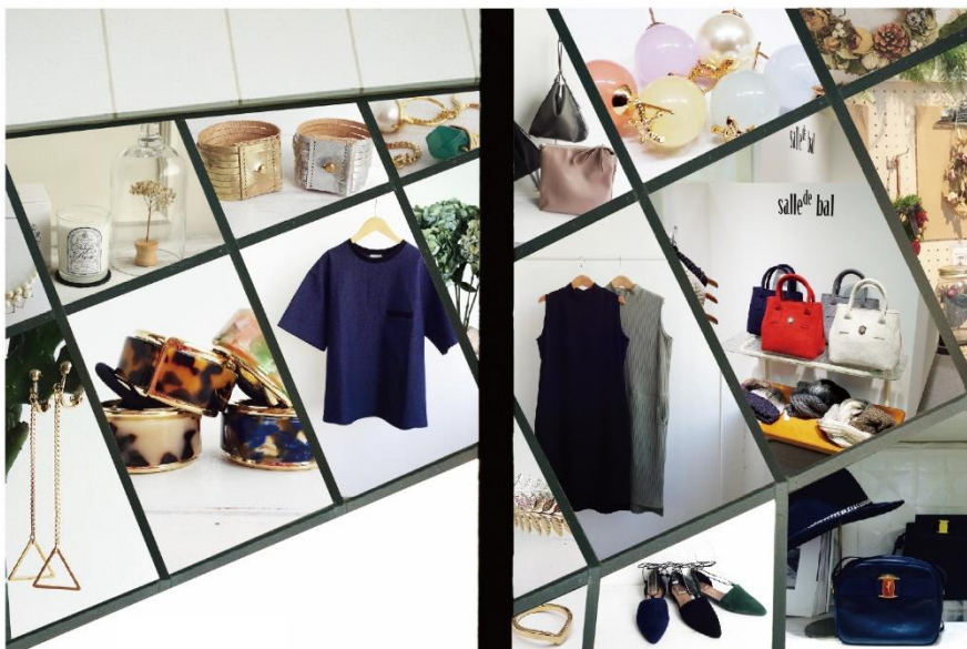
ブランドイメージ

東京メトロ駅構内店舗および商業施設の企画・開発・運営管理、リテール事業を行う株式会社メトロプロパティーズ（本社：東京都台東区、代表取締役社長：齋藤敏和）は、東京メトロ池袋駅の駅チカ商業施設Echika（エチカ）池袋に、雑貨やアクセサリなどを取り揃えるセレクトショップ「salle de bal（サルデバル）」（株式会社スタンレーインターナショナル）を平成30年2月22日(木)にオープンいたします。