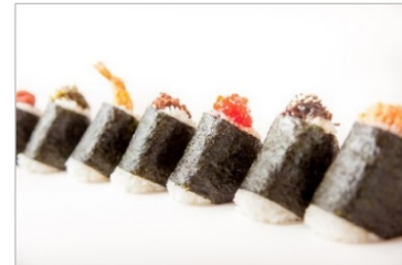
(商品イメージ) おにぎり各種 140円~

Echika池袋開業時から人気のおにぎり専門店「ぼんたぼんた」がオープンします。米の匠「五ツ星お米マイスター」が特別精米した最高級のお米“一等米”を使用しています。炊きたてのふっくらごはんに、種類豊富な特選具材がぎっしりと詰まったおにぎりです。テイクアウトはもちろんのこと、イートインスペースでは、卵かけごはんやお茶漬けもお楽しみいただけます。