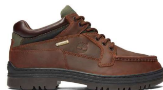
ヘリテージ GTX モックトゥ ミッド 税込30,800円