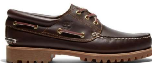
3eyeクラシックラグ 税込25,300円