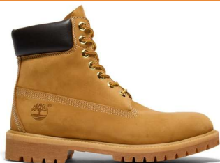
6インチ プレミアム ウォータープルーフ ブーツ 税込30,800円