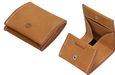
オリジナルコインポーチ (イメージ)