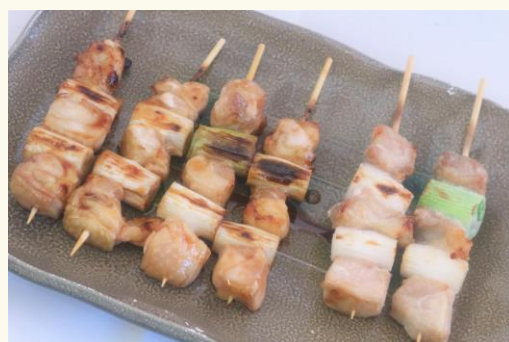
国産やきとり（もも串・ねぎま串・皮串など） 各140円（税込）

北海道日高産昆布エキスと静岡焼津産かつお節だしなど、8種の旨みだし原料をブレンドした合わせだしで炊きあげた香ばしい1品となっております。