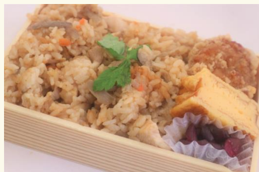
はなやの鶏めし 540円（税込）

北海道日高産昆布エキスと静岡焼津産かつお節だしなど、8種の旨みだし原料をブレンドした合わせだしで炊きあげた香ばしい1品となっております。