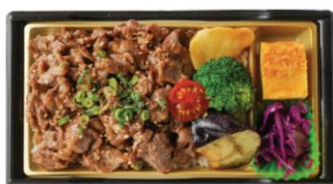
アングス牛の極上焼肉弁当 980円（税込）