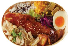
豚しゃぶごまポンと 銀鮭の照り焼き弁当 750円（税込）