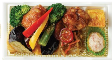
黒酢からあげと ゴロゴロお野菜弁当 730円（税込）