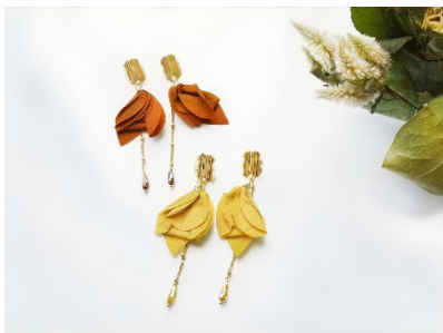
ゴールドメタルのフラワーピース