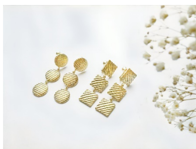
メタルプレートの3連イヤリング