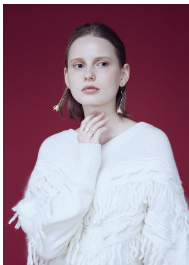
ブランドイメージ