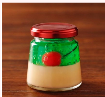
メロンソーダプリン 500円（税込）