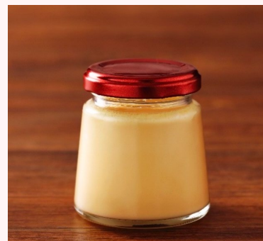
なめらかプリン 500円（税込）