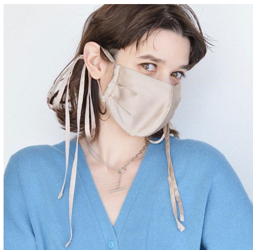
シルクリボン立体型セレブマスク 3,740円（税込）