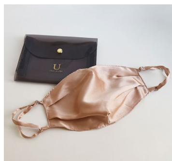
立体型セレブマスク 2,750円（税込）