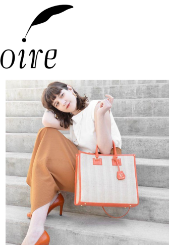
アングルトートバッグ 9,790円（税込）